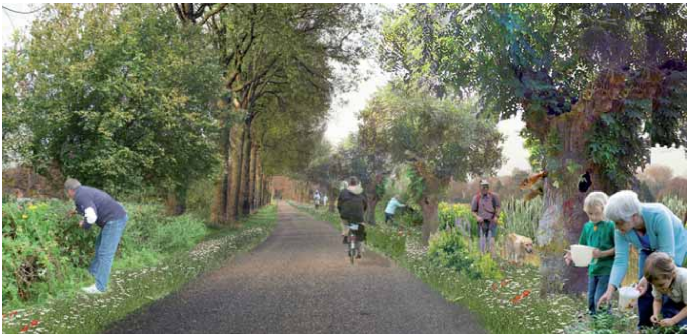
Collage met inrichtingsideeën voor Koudenoord te Nistelrode