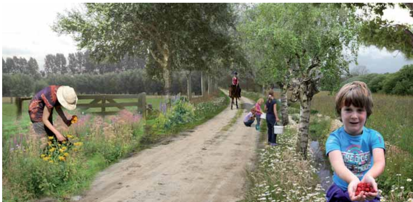
Collage met inrichtingsideeën voor Ruitersweg te Heesch