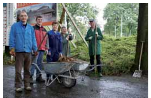
Tuingroep de Nistel